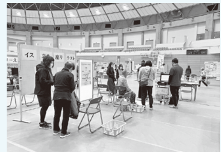
フェスタの体力測定ブース

なつたため、私にとっては初めてのフェスタになりました。2日間とも好天に恵まれ、たくさんの方々が来場されていました。私は、町民体育館のブースで「体力測定」を担当させていただきました。内容としては、いす立ち上がりテストと上体起こしを行いました。いす立ち上がりテストは30秒間にいすから何回立ち上がるができるかを測定するテストです。このテストを行うことで、下肢筋力などのくらいあるのかを確認することができます。一般的には、15回以下になってしまうと転倒リスクが高くなると報告されています。上体起こしは、仰向けに寝た状態から上半身を起こすテストです。腹筋は日常ではあまり使われておらず、腹筋を鍛えることは、たるんだお腹を引き締め、シェイプアップするという効果はもちろん、腰痛の予防・解消法としても重要と言われています。 また昨年11月4日には、多目的研修集会施設で高齢者e