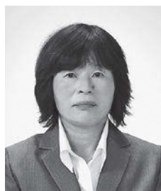
浮金下地区 生天目 泉