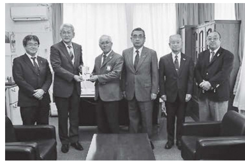
町長に寄付を手渡す太田会長(左から3番目)とライオンズクラブ会員の皆さん