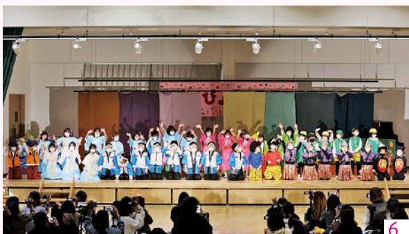
1、2、3_3歳児のリズムダンス 4_4歳児のダンスチーム 5_4歳児運動遊び 6_5歳児は劇やダンス、歌を披露