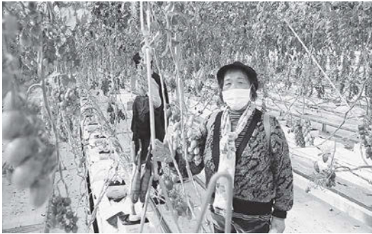
トマトの収穫体験を楽しむ参加者

ました。「ワンダーファームいわき」では、トマトの収穫体験から、トマトを使用した6次化商品の開発などについて学びました。「道の駅よつくら港」では、いわきの海産物や地場産品について見学しました。久しぶりの現場学習に受講生の皆さんは、お互い交流を深めながら興味津々に見入っている様子でした。