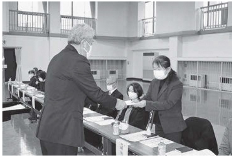
委嘱状交付式の様子