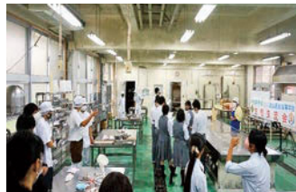
八重山農林高校で黒糖の加工実習体験