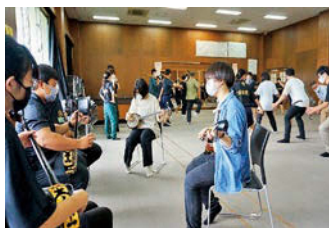
八重山農林高校の郷土芸能部と交流