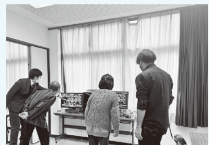
eスポーツを体験しています

スポーツ体験会に講師として参加をさせていただきました。『運動と認知症予防の関わりについて』という題名で健康講話を行いました。運動によって全身の血流が良くなることで、酸素や栄養が脳にしっかりと届きます。運動不足は体の血行不良を引き起こします。体が血行不良を起こすということは、脳にも十分な血流が流れなくなり、認知症の方の脳では、記憶を保持する海馬などで脳血流の低下が見られています。運動を行い、体を動かすことが効果的と言われています。以上のように運動と認知症予防は密接な関係があります。そして